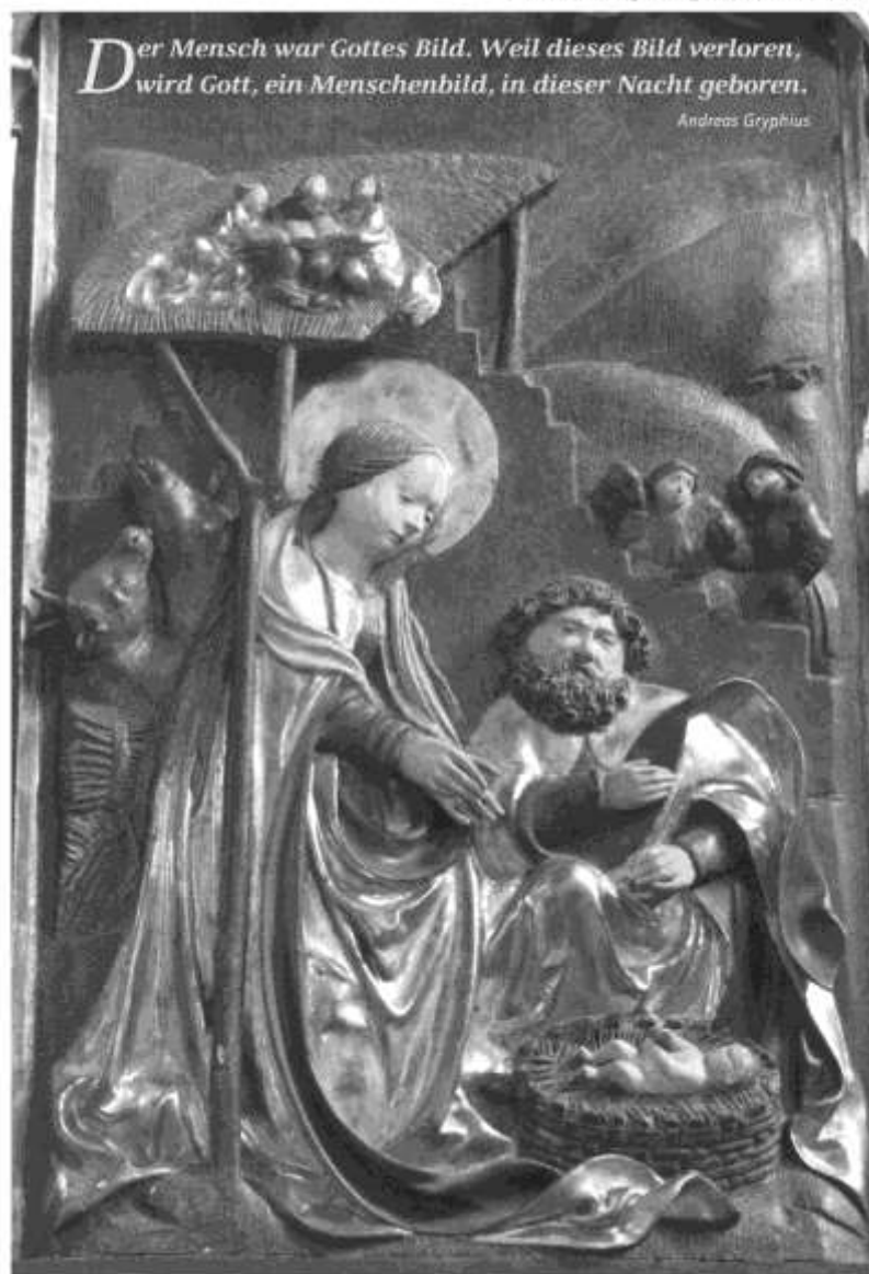
St. Leonhard, Regensburg